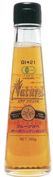
有機ブルーアガベシロップ イデアナチュラル 165g ¥840