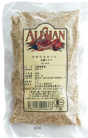
アリサン キヌア 200g ¥420