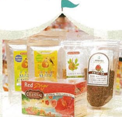
A. マテ茶・レッドジンジャーティー

栄養ミネラル豊富な、まるで「飲むサラダ」! 食物繊維がレタスの4倍と言われるマテ茶、肉食女子注目の、おいしく健康をサポートするお茶。ビタミン豊富なハーブティーもおすすめ。各367円、各467円、487円(後列左から)