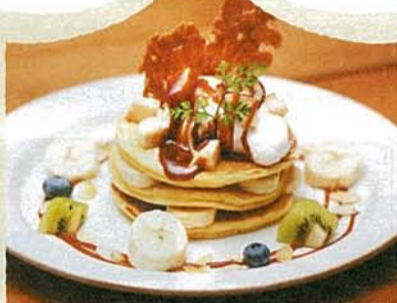
C. 生キャラメルバナナパンケーキ

ふわっと甘い、くせになるおいしさのパンケーキ。ふわふわのパンケーキに、口どけの良いクリームとバナナがベストマッチ。ピクニックに仕上がった特製の生キャラメルソースが香ばしいアクセントに、1,080円