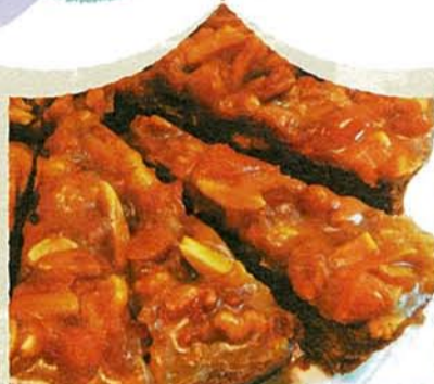
A. タルトショコラキャラメル

濃厚なキャラメルクリームにナッツがアクセント。キャラメルクリームに混ぜ込んだナッツとドライアズンがアクセント。さくさくでほろ苦いタルトショコラ生地とハーモニーを奏でる印象的なタルト。ピュッフェスイーツメニュー、ピュッフェ90分1,890円~