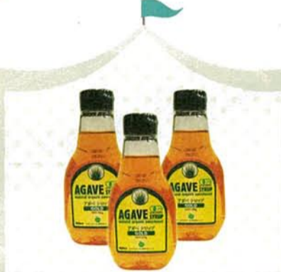
D. 有機アガベシロップ ゴールド

コクのある甘さで使いやすい天然甘味料。低GIで人気! オrganicで育てられたブルーアガベを原料とした上質の天然甘味料。自然なしっとりとした甘さで、後味もスッキリ。各945円