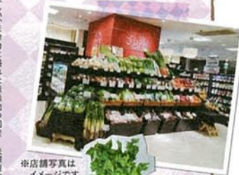
※店舗写真はイメージです。

体に優しい、生命力に溢れた無添加の国産ライオンや日本酒、ビールなども取り扱う。しっかりと味わって、日常使いはもちろんです。ギフトやおもてなしにもおすすめです。