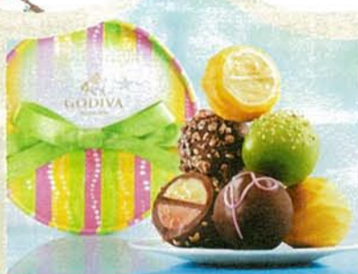
D. オセアン セレクション

爽やかに香る、夏限定のサマートリュフ。レモン風味のガナッシュが香る粒や、バナナクリームとストロベリームースが層になった粒など、5種類の限定トリュフの詰め合わせ。爽やかなフレーバーが夏にぴったり!2,205円